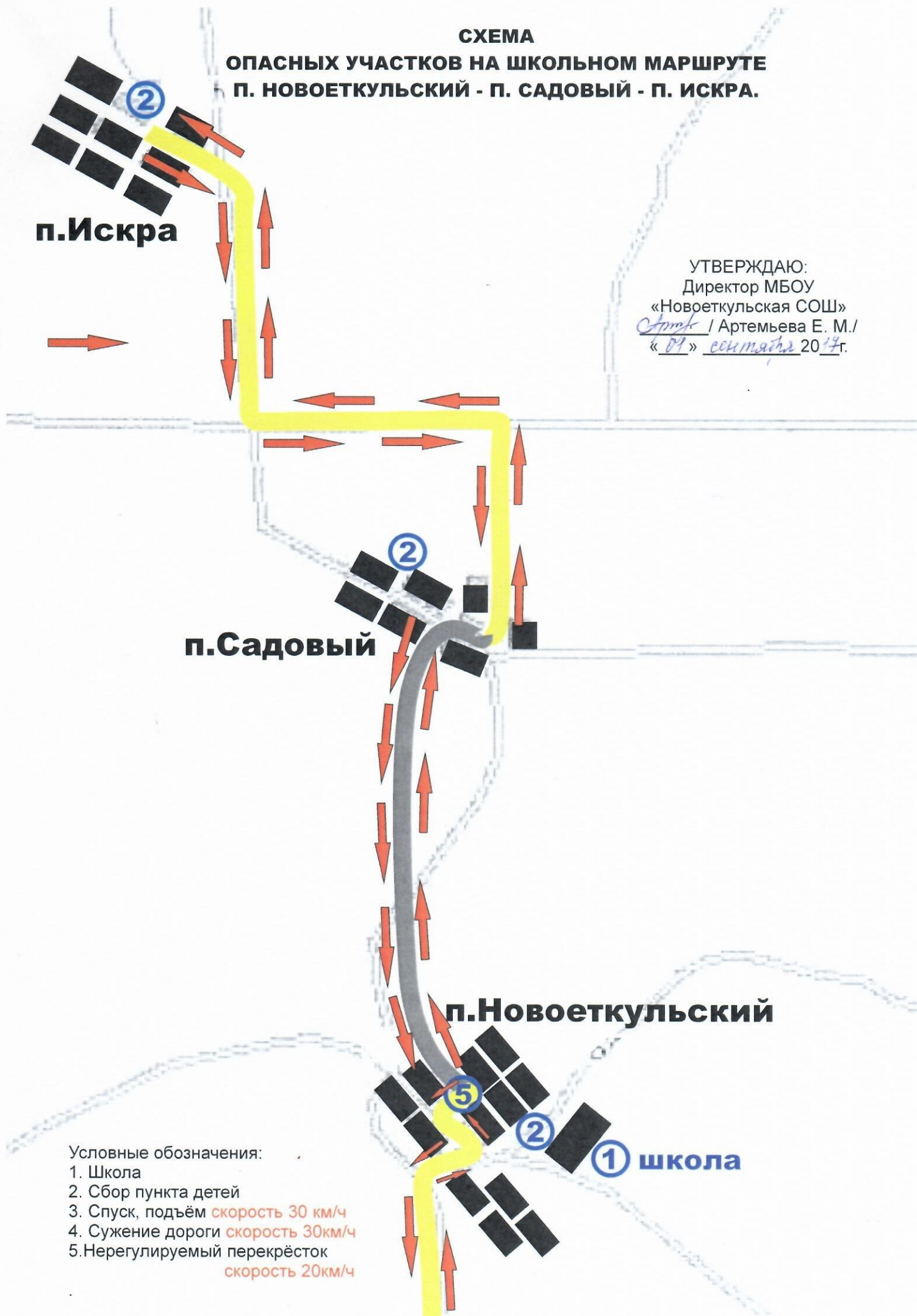
СХЕМА ОПАСНЫХ УЧАСТКОВ НА ШКОЛЬНОМ МАРШРУТЕ П. НОВОЕТКУЛЬСКИЙ - П. САДОВЫЙ - П. ИСКРА.