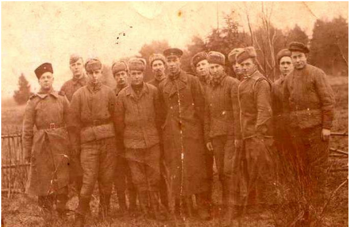
68-я Морская стрелковая бригада