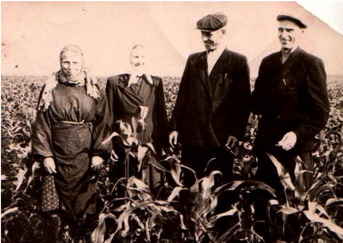
Бригадир полеводческой бригады