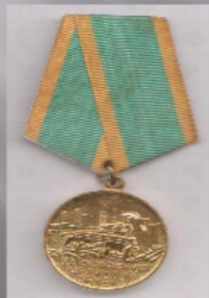
МЕДАЛЬ «ЗА ОСВОЕНИЕ ЦЕЛИННЫХ ЗЕМЕЛЬ»