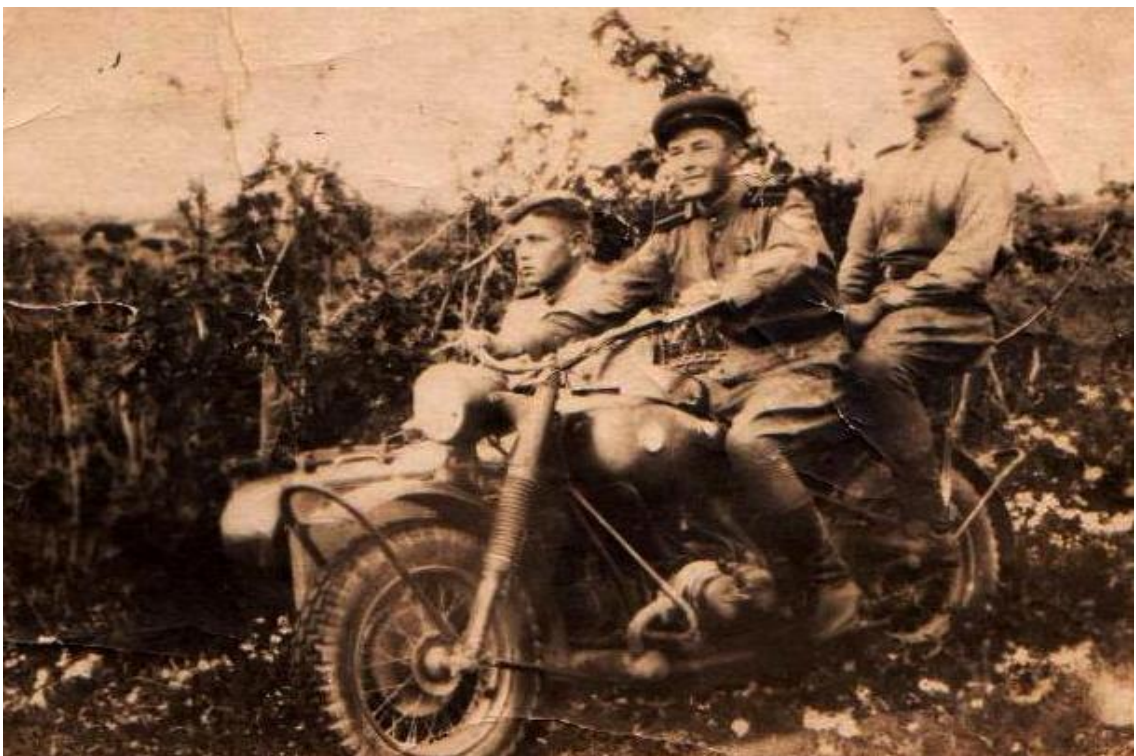
Вот кажется еду! Далекий еще путь. Лучше сменить мотоцикл на паровоз! г. Кенигсберг. 30.07.1945 г.