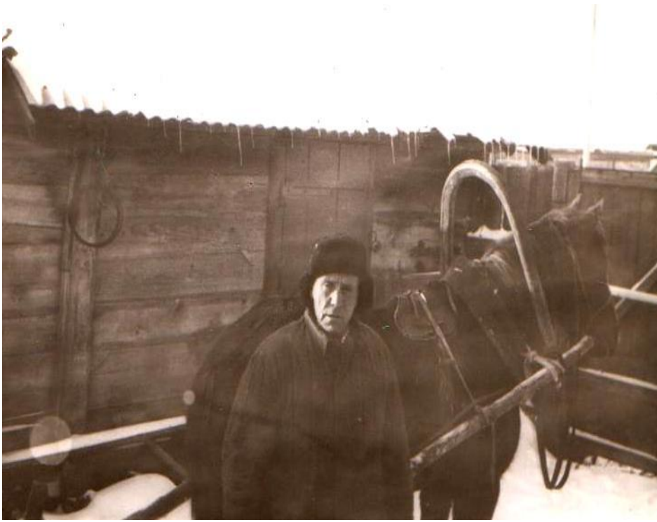
На заслуженном отдыхе.