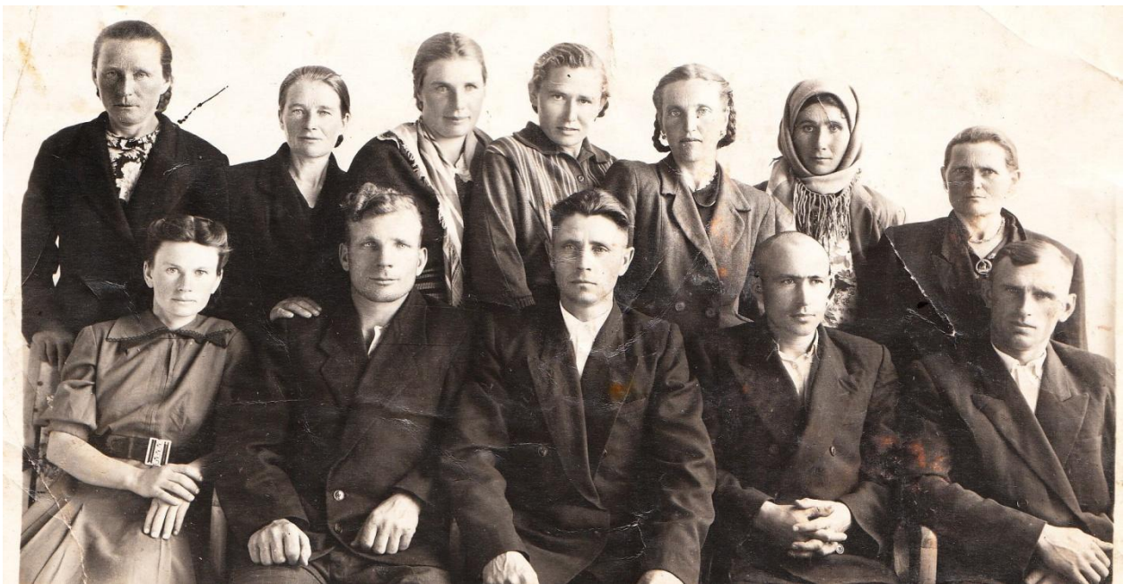
Поездка на совещание работников животноводства колхоза «Красный герой» в совхоз «Имени Горького» 1958 год.