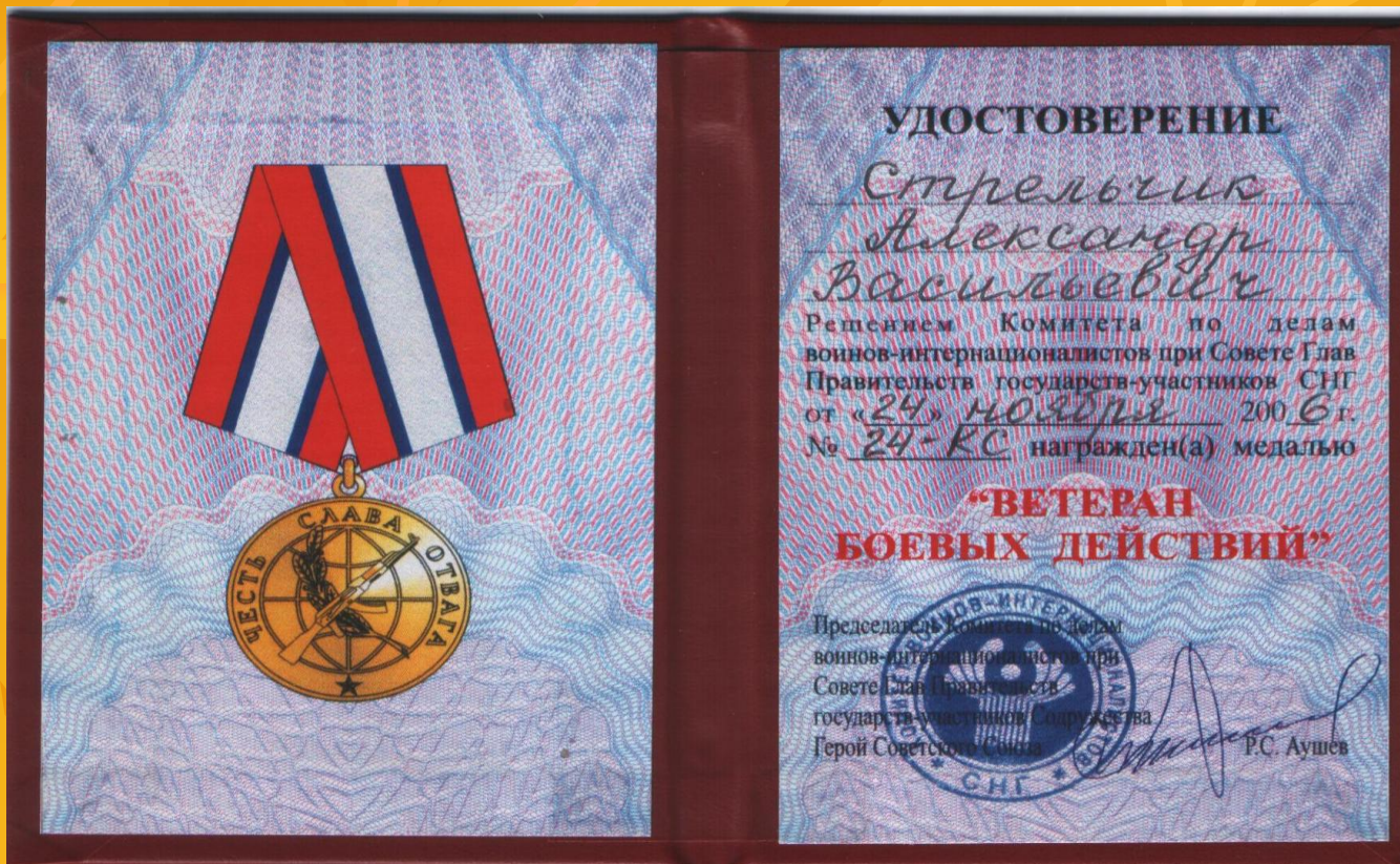
Медаль «Ветеран боевых действий»